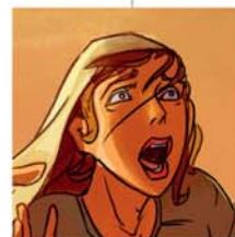
(INAUDI NGA ANAK)