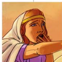
(INAUNA NGA ANAK)