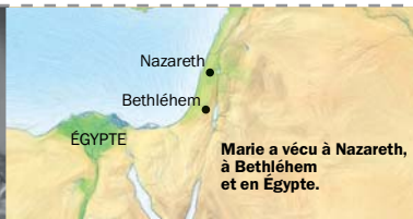
Marie a vécu à Nazareth, à Bethléhem et en Égypte.