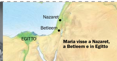
Maria visse a Nazaret, a Betleem e in Egitto