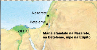
Maria afandaki na Nazarete, na Beteleme, mpe na Ezipito