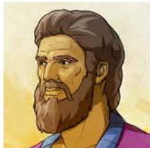
創世記 41:15, 16