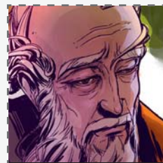
A. Israel, ukon Jacob

“WALA AKO MAGHUNAHUNA NGA MAKAKITA SANG IMO NAWUNG; KAG YARI KARON, ANG DIOS NAGPATAN-AW MAN SA AKON SANG IMO KABATAAN.”—GENESIS 48:11.