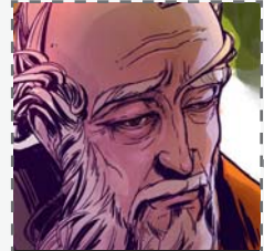
ㄱ. 이스라엘 족 야곱

“내가 네 얼굴을 보리라고는 생각도 못 하였는데, 이제 하느님께서 나로 네 자식까지 보게 하셨구나.” —창세 48:11.