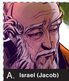
A. Israel (Jacob)