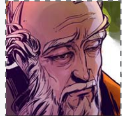
A. Israel, o Jacob

“HINDI KO AKALAING MAKIKITA KO ANG IYONG MUKHA, NGUNIT NARITO, IPINAKITA RIN SA AKIN NG DIYOS ANG IYONG SUPLING.” —GENESIS 48:11.