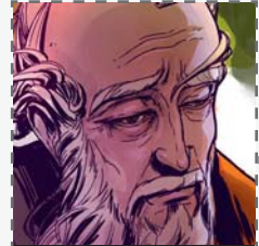
А. Израиль, или Иаков

«Я И ТВОЁ—ТО ЛИЦО НЕ НАДЕЯЛСЯ УВИДЕТЬ, А БОГ ПОЗВОЛИЛ МНЕ УВИДЕТЬ ДАЖЕ ТВОИХ ДЕТЕЙ» (БЫТИЕ 48:11).