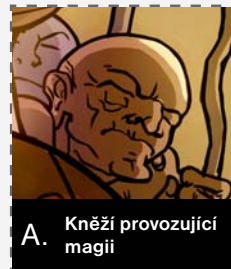
A. Kněží provozující magii