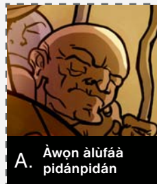
A. Àwọn àlufáa pidánpidán