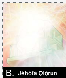
B. Jèhófà Ọlórún