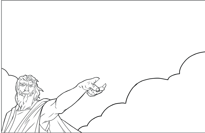
1. Keluaran 14:15, 16

Siapa saja tokoh Alkitab yang ada di gambar ini, dan benda apa yang kurang? Baca ayat-ayatnya, tulis jawabanmu, lengkapi gambarnya, dan warnailah.