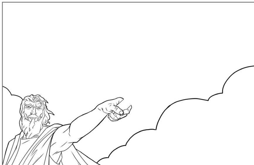
1. 2. Mozus 14:15, 16

Kādas Bībelē aprakstītās personas ir redzamas attēlā, un kādu priekšmetu trūkst? Izlasi Bībeles pantus, uzraksti atbildes, uzzīmē trūkstošos priekšmetus un izkrāso attēlus.