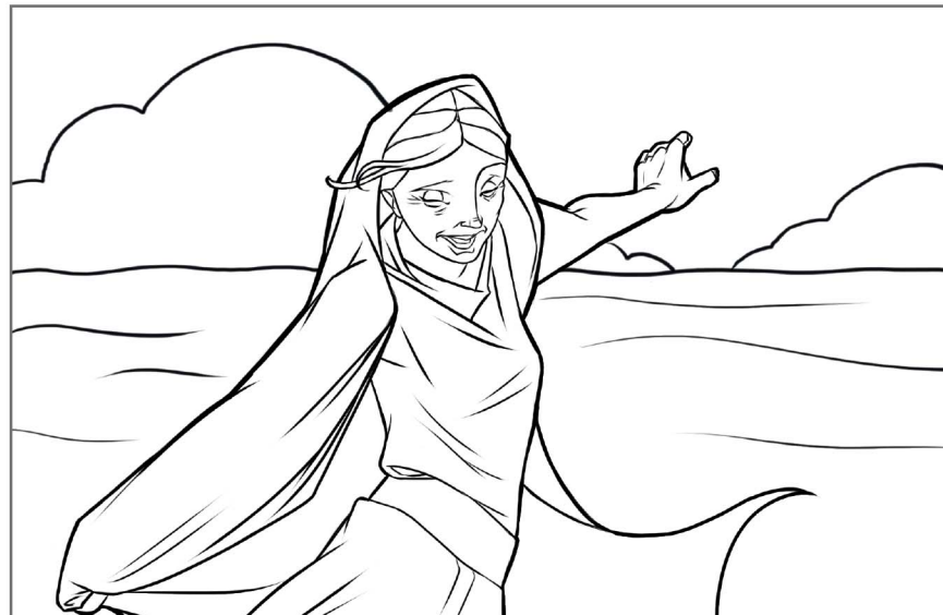
2. Andre Mosebok 15:20