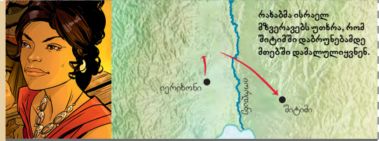
რახაბმა ისრაელი მზვერავებს უთხრა, რომ შიტიმში დამალულნი იყვნენ მთებში დამალულიყვნენ.