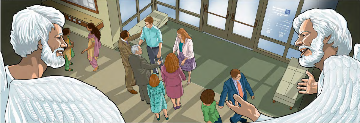
Mawudɔlawo kpɔã dzidzɔ ne ame deka pe gɔ hã trɔ va Yehowa gbɔ.—Luka 15:10

Aleke mawudɔla wonutefewo kpe de Mawu fe amewo nɔ le blema?