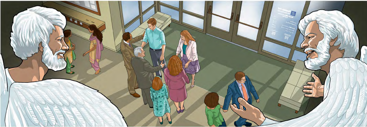
ἤwei βῶfoi λε nάa miishεε kε eshafeelo kome po ku esεε keba Yehowa ηῶo.—Luka 15:10

Μεε gbε no ηwei βῶfoi anokwafoi ye amεbua Nyῶηmo webii bei ko ni eho le?