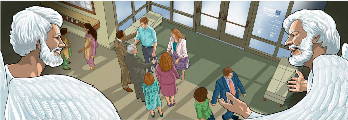
Nagakalipay ang mga anghel bisan isa lang ka tawo ang magbalik kay Jehova.—Lucas 15:10

Paano ginbuligan sang matutom nga mga anghel ang katawhan sang Dios sadto?