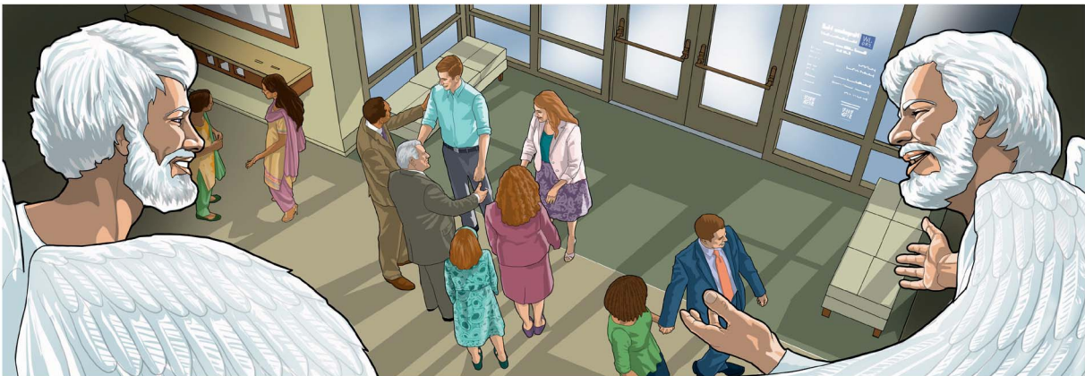
Para malaikat bersukacita apabila seseorang kembali kepada Yehuwa.—Lukas 15:10

Bagaimanakah malaikat yang setia membantu umat Tuhan pada masa lampau?