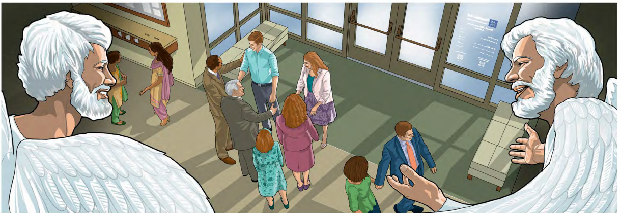
Malaika hushangilia hata mtu mmoja anapomrudia Yehova.—Luka 15:10

Malaika waaminifu waliwasaidiaje watumishi wa zamani wa Mungu?