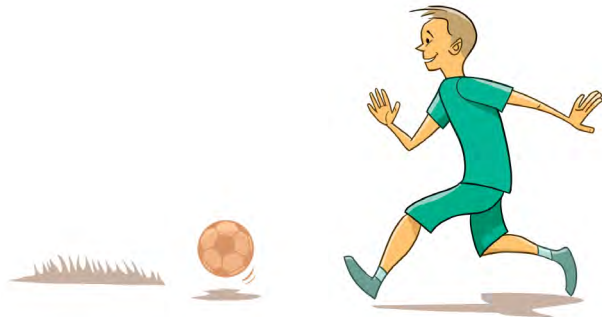
ZABAVA I OPUŠTANJE

Zašto je bolje najprije ispuniti svoje obaveze, a onda se opušitati i zabavljati? Ovaj radni list pomoći će ti da dobiješ odgovor na to pitanje.