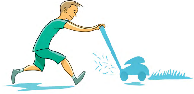
งานที่ได้รับมอบหมาย