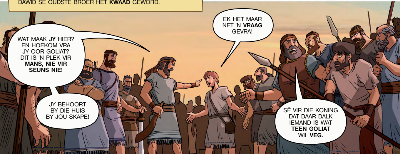
DAWID SE OUDSTE BROER HET KWAAD GEWORD.

WAT MAAK JY HIER? EN HOEKOM VRA JY OOR GOLIAT? DIT IS 'N PLEK VIR MANS, NIE VIR SEUNS NIE!