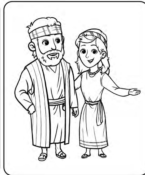
Aquila ja Priscilla