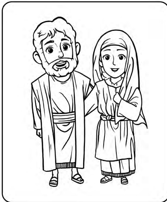
Joosef ja Maria