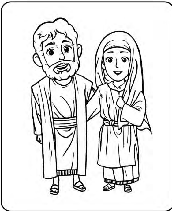
იოსები და მარიაში (მათე 1:16)