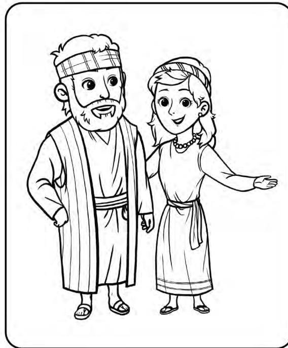
아굴라와 브리스길라 사도행전 18:1-3, 18-19