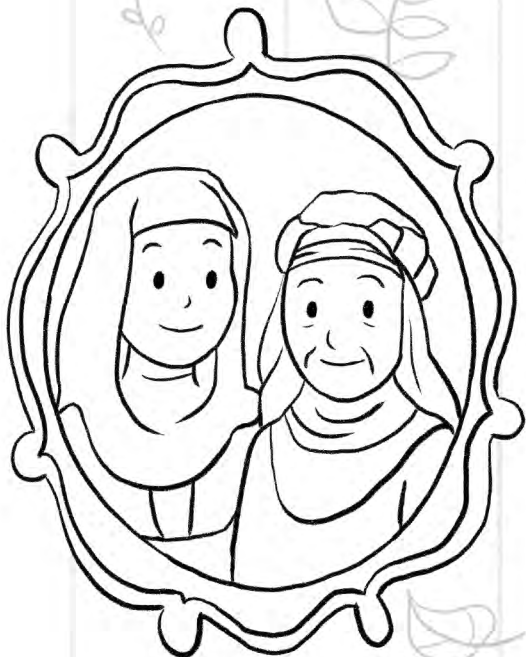
Rut dan Naomi

Semua orang, tua dan muda, bisa kamu jadikan teman kalau mereka sayang Yehuwa! Orang tua, bacalah Rut 1:16, 17 bersama anak kalian. Lalu, bahaslah bagaimana mereka bisa berusaha berteman dengan saudara-saudari yang lebih tua di sidang. Anak-anak, warnailah gambar-gambar di bawah ini. Pada kotak yang kosong, gambar atau tempel fotomu bersama dengan teman yang lebih tua di sidang.