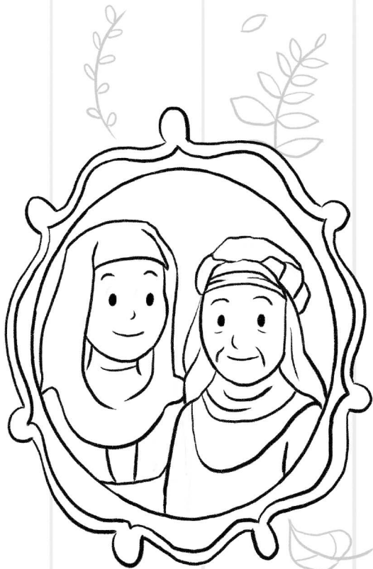
Рут менен Наами

Жахабаны жакшы көргөндөрдүн баары, жаш-кары дебей, жакшы дос боло алышат. Ата-энелер, балдарыңар менен Рут 1:16, 17ни окугула. Анан жыйналыштагы кары бир туугандар менен кантип достошсо болорун талкуулагыла. Балдар, төмөнкү сүрөттөрдү боёгула. Бош рамкага жыйналыштагы улгайган досуңардын, өзүңөрдүн сүрөтүңөрдү тарткыла же чаптагыла.