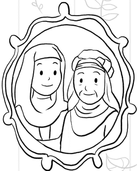
Ruta in Naomi

Pravi prijatelji so lahko katere koli starosti, če le ljubijo Jehova. Starši, skupaj z otroki preberite Ruto 1:16, 17. Nato se z njimi pogovarjajte o tem, kako si lahko med starejšimi kristjani v občini poiščejo prave prijatelje. Otroci, pobarvajte spodnji slike. Nato v prazen okvir narišite ali pa prilepite sliko sebe in starejšega prijatelja oziroma prijateljice iz svoje občine.