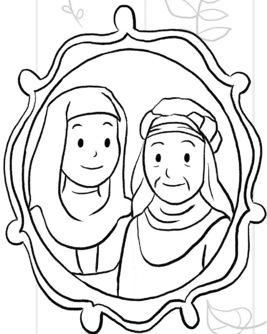
Руфь и Ноеминь

Главное не возраст, а чтобы твои друзья любили Иегову. Родители, прочитайте с детьми Руфь 1:16, 17. А потом обсудите, как они могут подружиться с пожилыми братьями и сёстрами в собрании. Дети, раскрасьте картинки. В пустой рамке нарисуйте себя и своего друга старшего возраста из собрания или приклейте туда вашу с ним фотографию.