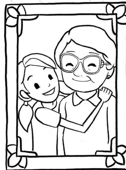
Tósin àti Arábinrin Ènìolá