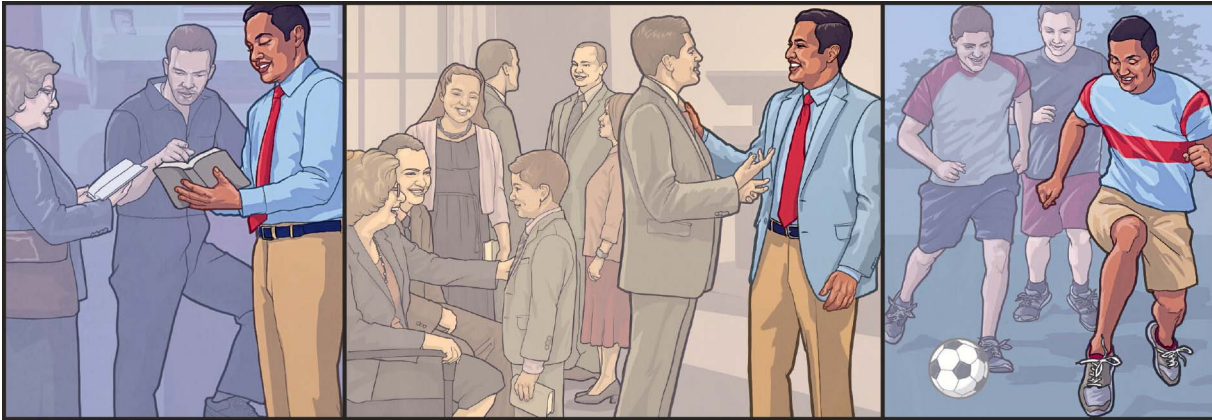
Mahazo fitahiana be dia be isika rehefa manompo an'Andriamanitra miaraka amin'ny vahoakany

Raha tiantsika 'handray antsika' Andriamanitra, izany hoe hankasitraka antsika, dia inona no tokony hataontsika raha manaraka fivavahana tsy tiany isika?