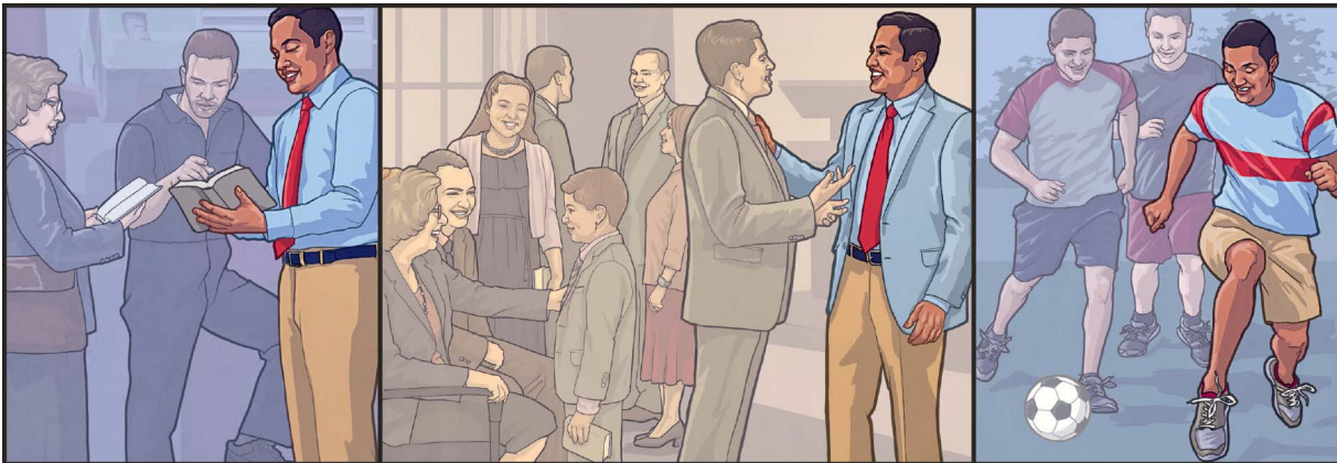
Llaqtanwan kуска Diosta servispapa askha bendicionkunatan chaskinchis

Sichus munanchis adorasqanchista Jehová Dios chaskiwananchista chayqa, ¿imatan ruwananchis pantasqa religionpa ruwayninkunata ruwashanchisraq chayqa?